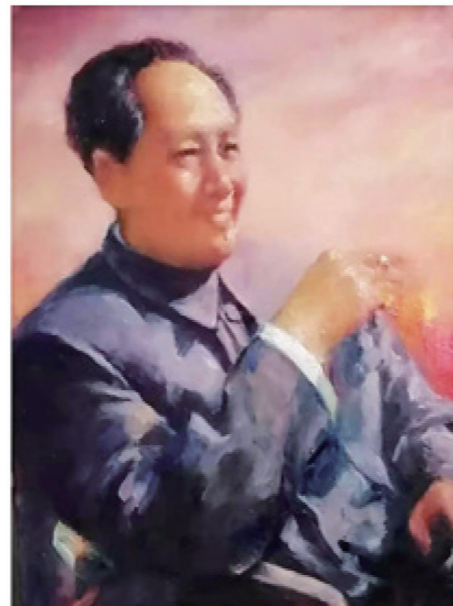
油画《指点江山》/ 应凤仙