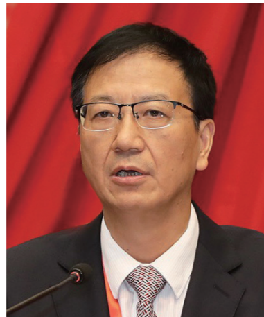
党委常委、校长姜建明

列；更名“苏州工学院”，为建设成为新型工业大学而持续奋斗；强化以工科为特色、多学科协调发展的学科体系，学科专业体系与区域产业链、创新链更加契合；内涵发展成效显著，建成特色鲜明、质量著称的一流应用型大学。