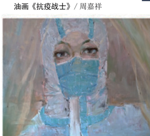
油画《抗疫战士》/ 周嘉祥