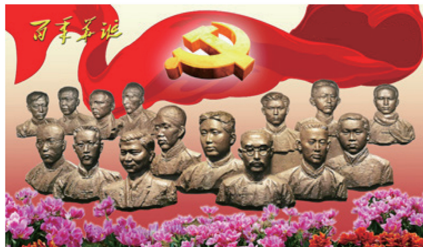
宣传画《百年华诞》/ 钱伟明