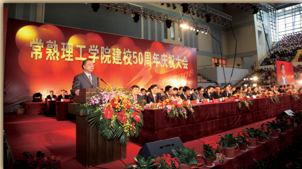
常熟理工学院建校 50 周年