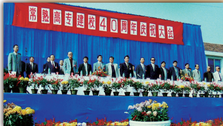
常熟高等专科学校建校 40 周年