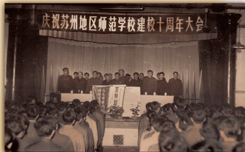
苏州地区师范建校十周年