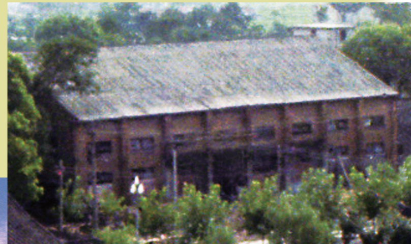
苏州师范专科学校时期。