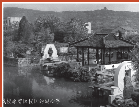
我校原曾园校区的湖心亭