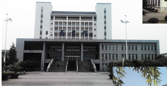
常熟理工学院东南校区。