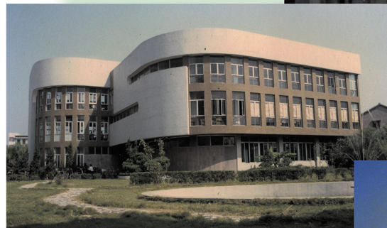
常熟职业大学时期。