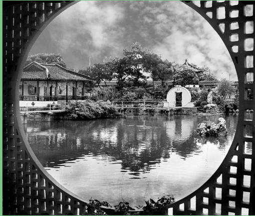
苏州师专曾园校区校园一角。