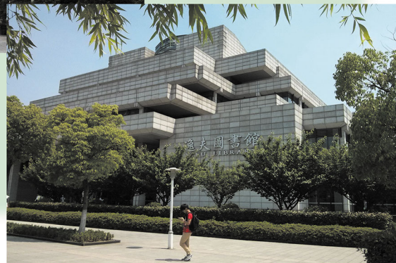
常熟理工学院东湖校区。