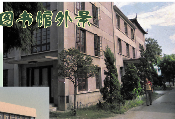
苏州师范专科学校时期。