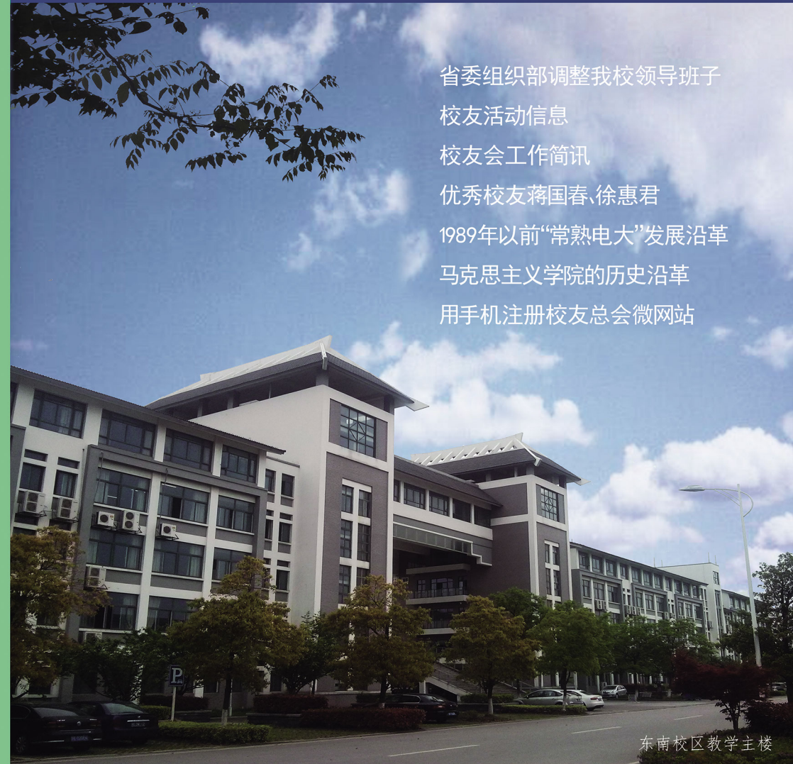
东南校区教学主楼

省委组织部调整我校领导班子 校友活动信息 校友会工作简讯 优秀校友蒋国春、徐惠君 1989年以前“常熟电大”发展沿革 马克思主义学院的历史沿革 用手机注册校友总会微网站