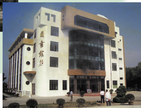
常熟高等专科学校时期。