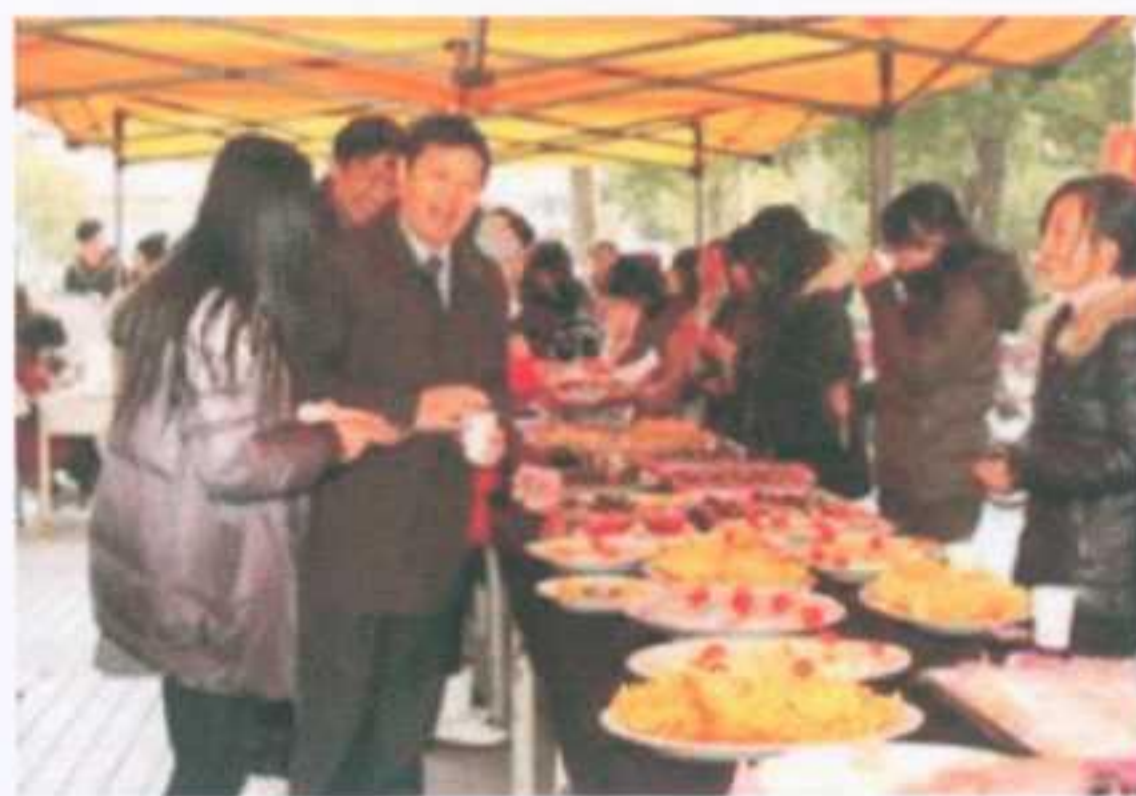
《迎新·味道》二等奖