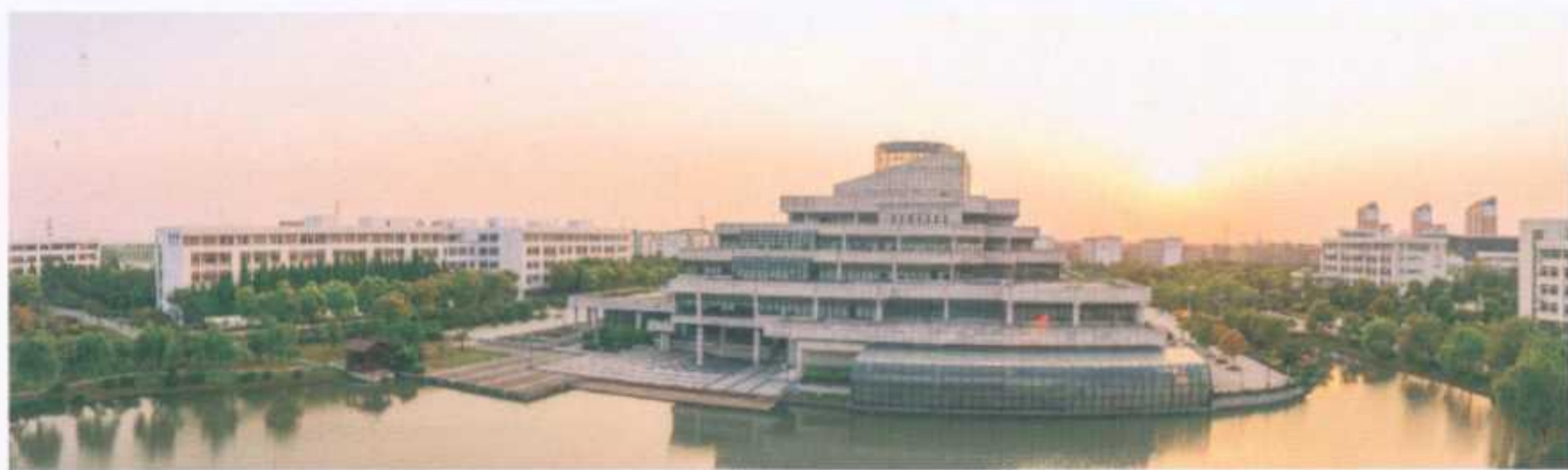
《落日余晖》一等奖

在学校升本十周年之际，由常熟理工学院党委宣传部和校工会联合主办、教职工摄影协会和天银机电摄影俱乐部具体承办的升本十周年纪念暨第三届“今日摄影杯”摄影比赛，于2014年6月圆满结束，《落日余晖》、《迎新·味道》等十四件优秀作品得到评委肯定。