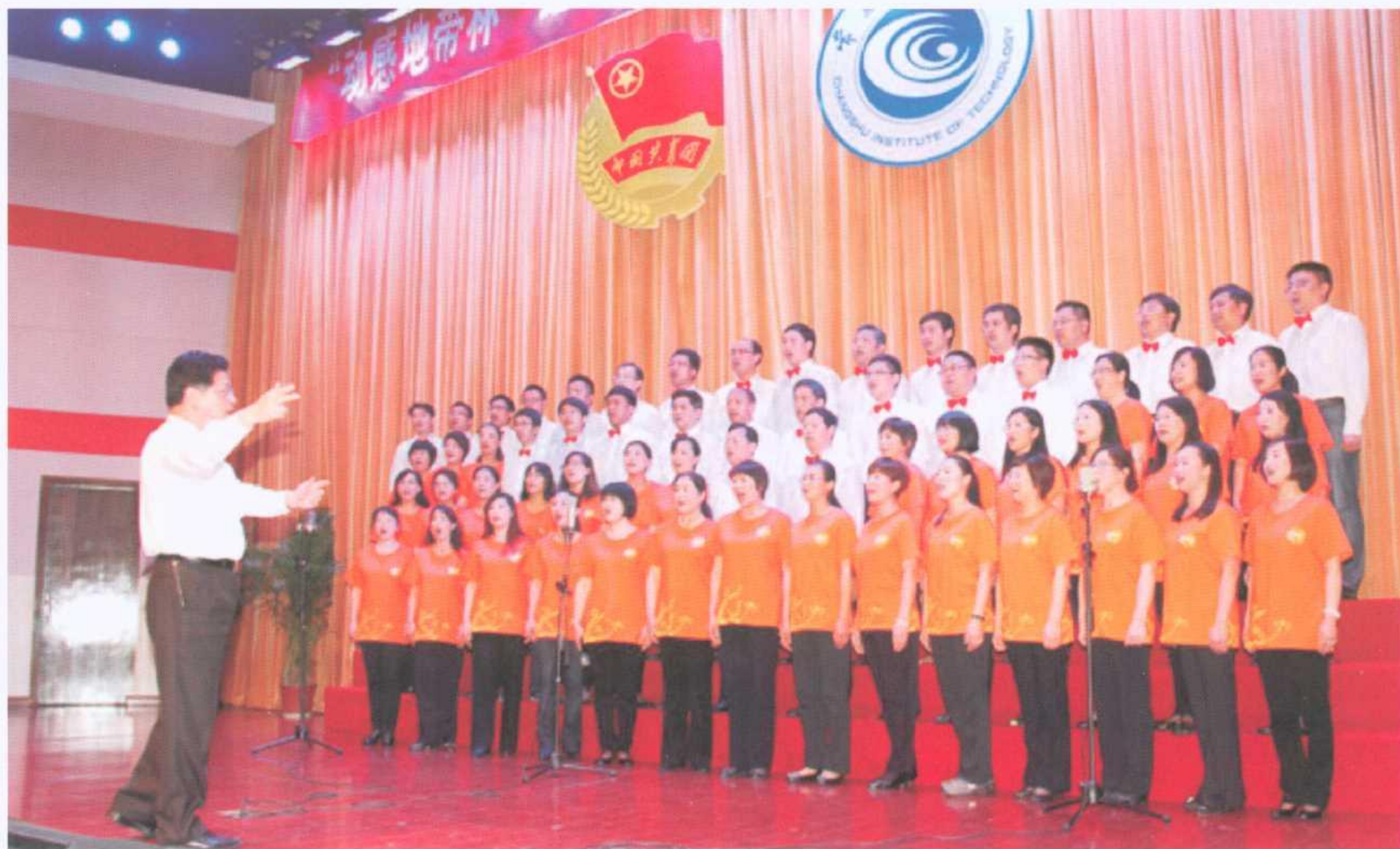
全体校领导参加的教工合唱团在演唱

在学校庆祝升本十周年之际，举办本届师生大合唱比赛具有特殊的意义，它增进了师生间的感情，激发了广大师生的爱国、爱党、爱校热情，提高了广大师生为我校应用技术大学建设贡献力量的历史责任感和使命感。