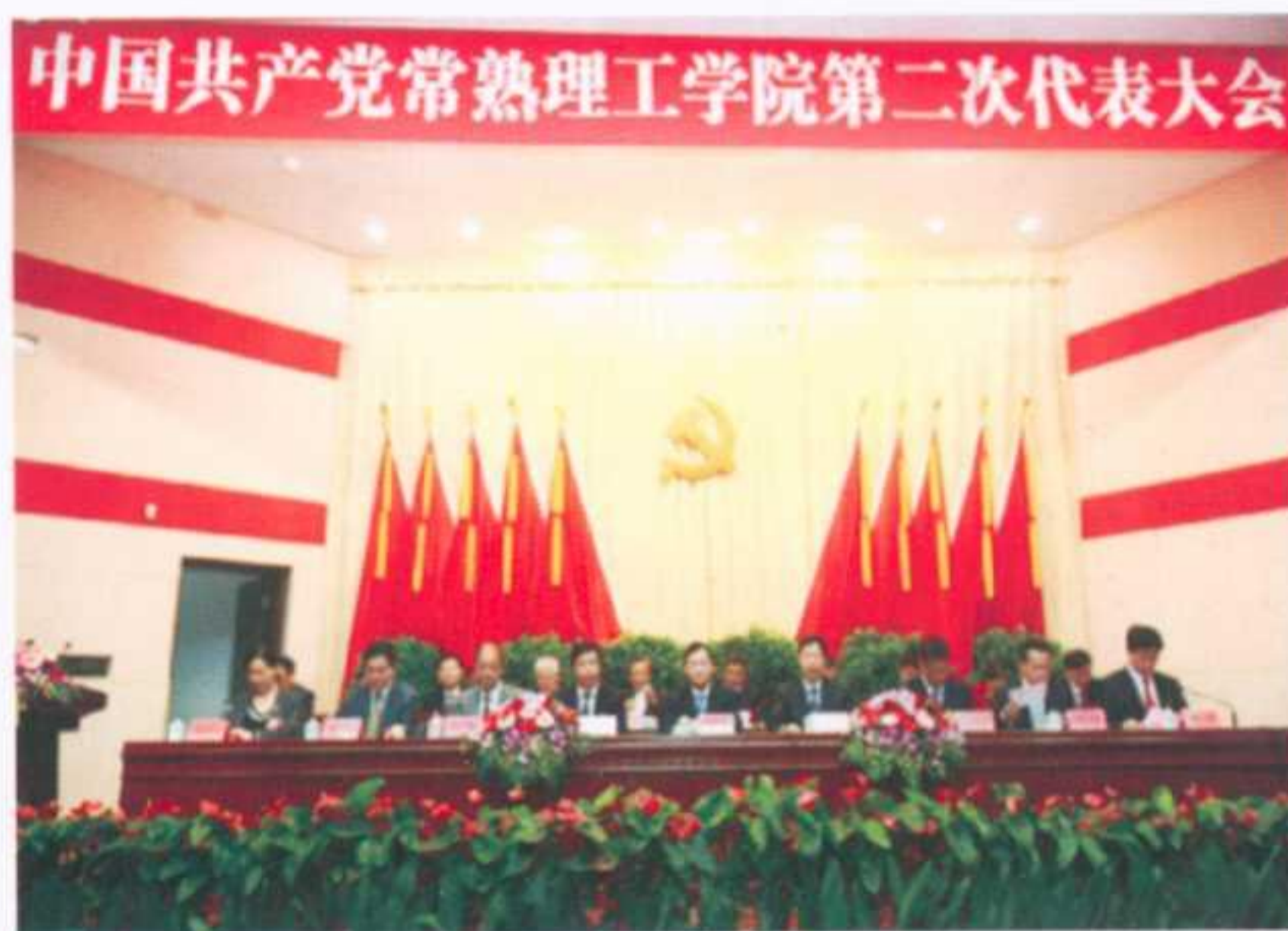
召开第二次党员代表大会