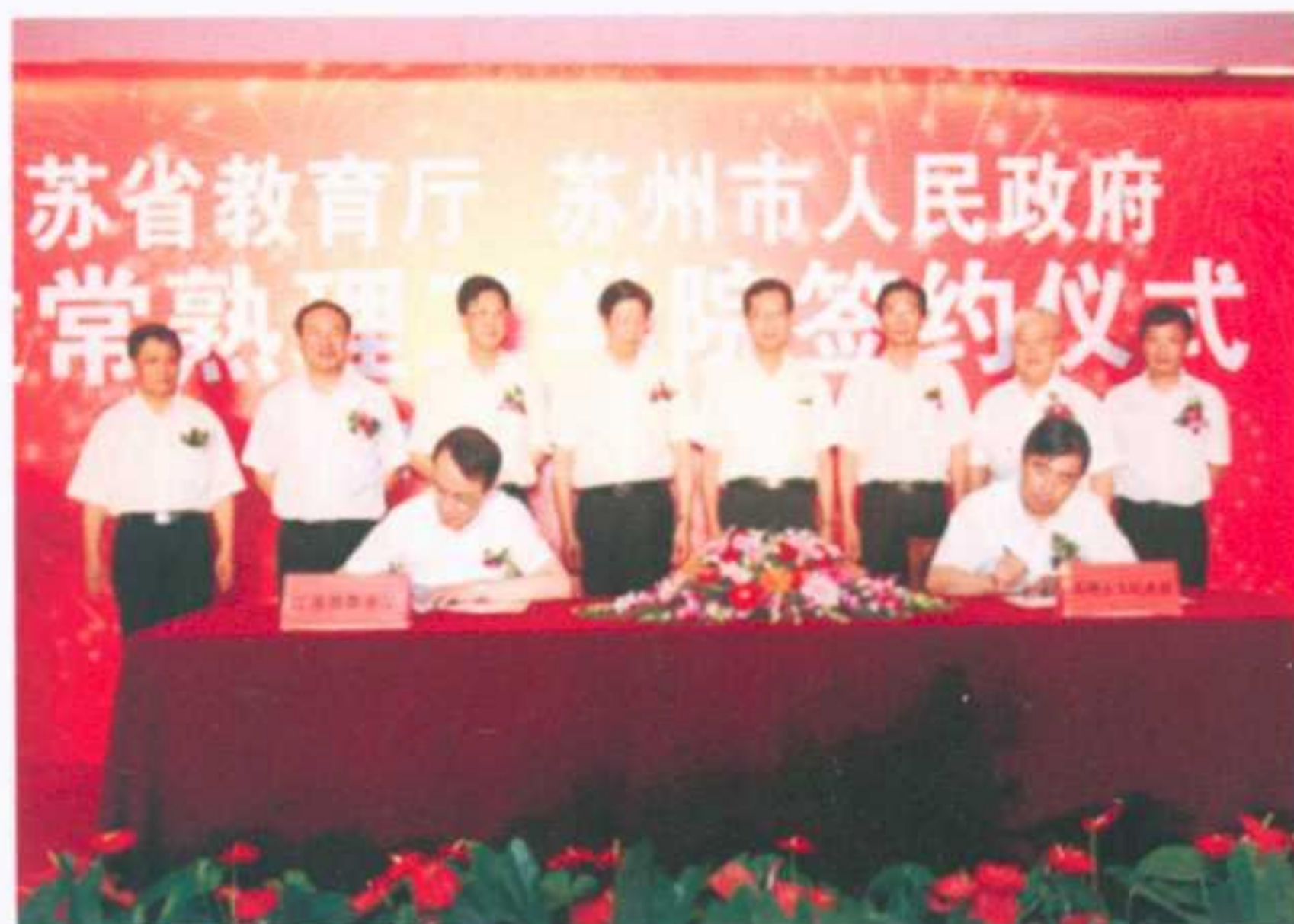
省市共建常熟理工学院