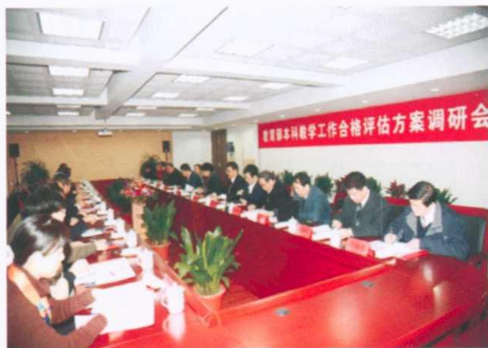
通过本科教学工作合格评估